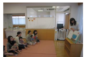
大型絵本の読み聞かせ

[参加方法] 予約の必要はありませんので、自由に参加して頂けます。お話が始まるまで親子で遊んでお待ち下さい。