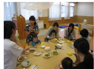
離乳食試食会(0歳クラス)

[参加方法] 各期の約2ヶ月前にメンバー募集のお知らせをします。電話での申し込みも受け付けておりますが、初めての方には一度、ルーム開放日等に参加して頂き、お子さんの遊ぶ様子や、支援センターの雰囲気を感じて頂いてからの申し込みをお勧めしています。