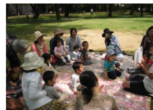
公園へお散歩(2歳クラス)