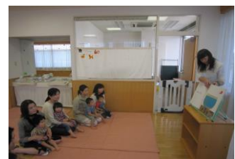
大型絵本の読み聞かせ

[参加方法] 予約の必要はありませんので、自由に参加して頂けます。お話が始まるまで親子で遊んでお待ち下さい。