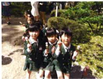
兼六園へお花見で～す！

園目標 「元気な体、やさしい心」 ～かけがえのない「出会い」そして「いのち」を大切に～ 「あいさつする、なかよくする、がんばる力」 を育てます