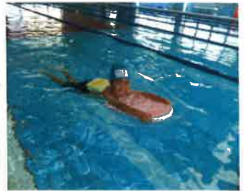
スイミングスクール

園目標 「元気な体、やさしい心」 ～かけがえのない「出会い」そして「いのち」を大切に～ 「あいさつする、なかよくする、がんばる力」 を育てます